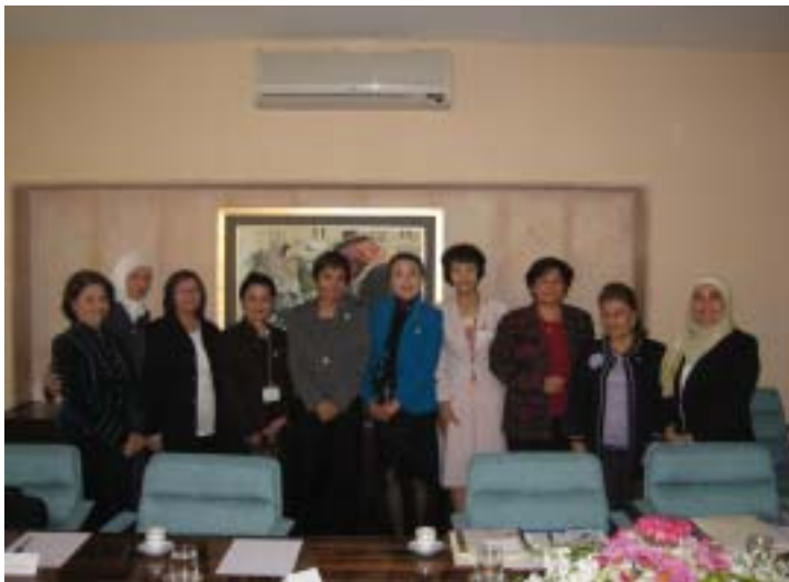
ヨルダンのバスマ女王と一緒に

日本・アラブ女性交流事業は、国連 NGO 国内婦人委員会が外務省の委託により開始した事業で10年以上の歴史があります。今年度はヨルダン、エジプト、そしてはじめての参加国であるシリアとの三国との交流事業となりました。